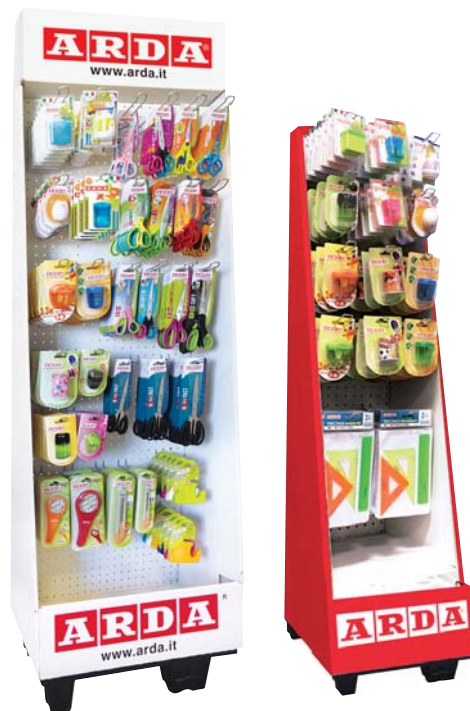
39 X 60 X 186 h. cm