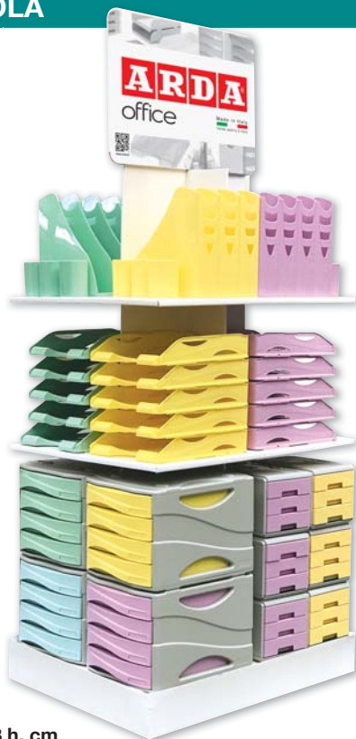
60 X 80 X 183 h. cm