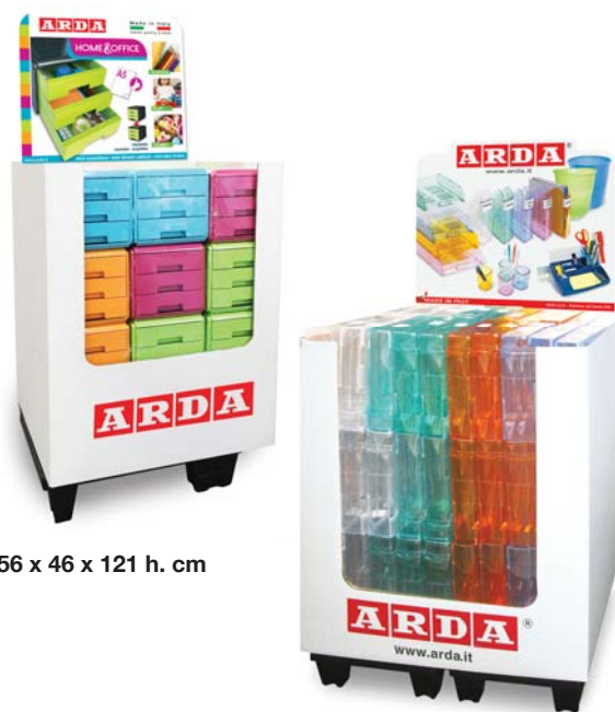
56 x 46 x 121 h. cm