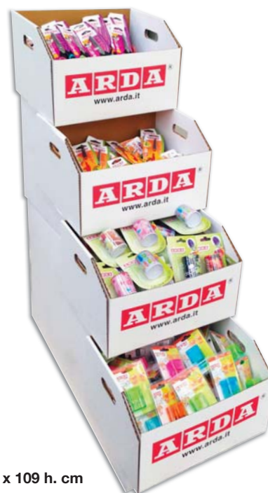
30 x 80 x 109 h. cm